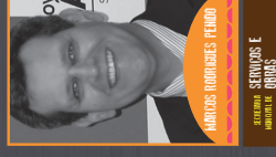
MARCOS RODRIGUES PERES SERVIÇOS E OBRAS