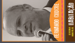
FERNANDO FIGUEIRA HABITAÇÃO