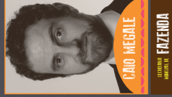
CÃO MEGALE FAZENDA