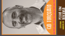
CID TORQUATO PESSOAS COM DEFICIÊNCIA