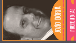
JOÃO DÓRIA PREFEITO(A)